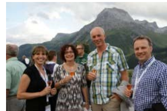
cars&friends Aug 2011